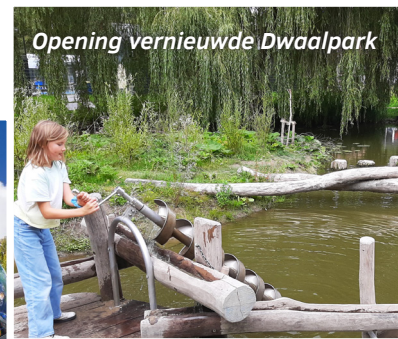
Opening vernieuwde Dwaalpark

Besluit over plannen nieuwe stadstoegang (auto en fiets)