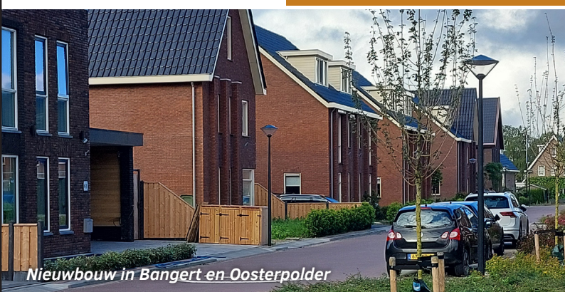
Nieuwbouw in Bangert en Oosterpolder

250 nieuwe woningen opgeleverd. Meer informatie staat op bouwprojecten.hoorn.nl