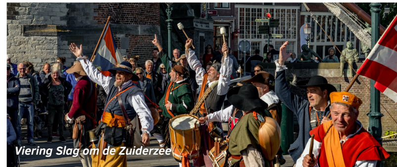
Viering Slag om de Zuiderzee

Verbeteren schoolgebouwen: start nieuwbouw Tandem en Spinaker