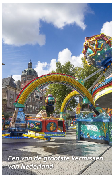
Een van de grootste kermissen van Nederland

5.800 huishoudens ontvingen energietoeslag