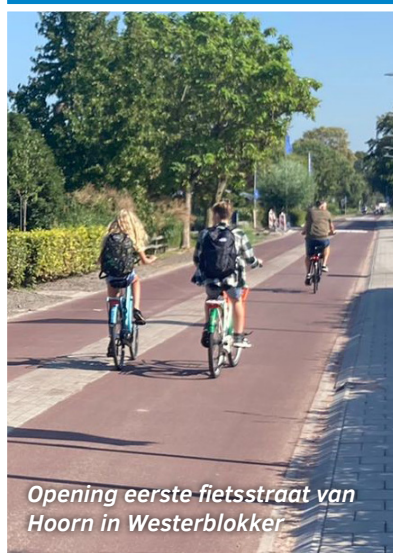
Opening eerste fietsstraat van Hoorn in Westerblokker

5.800 huishoudens ontvingen energietoeslag